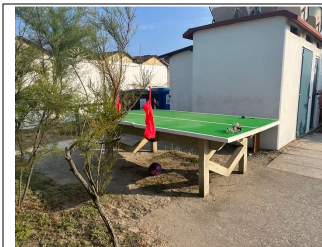
Area giochi per bambini